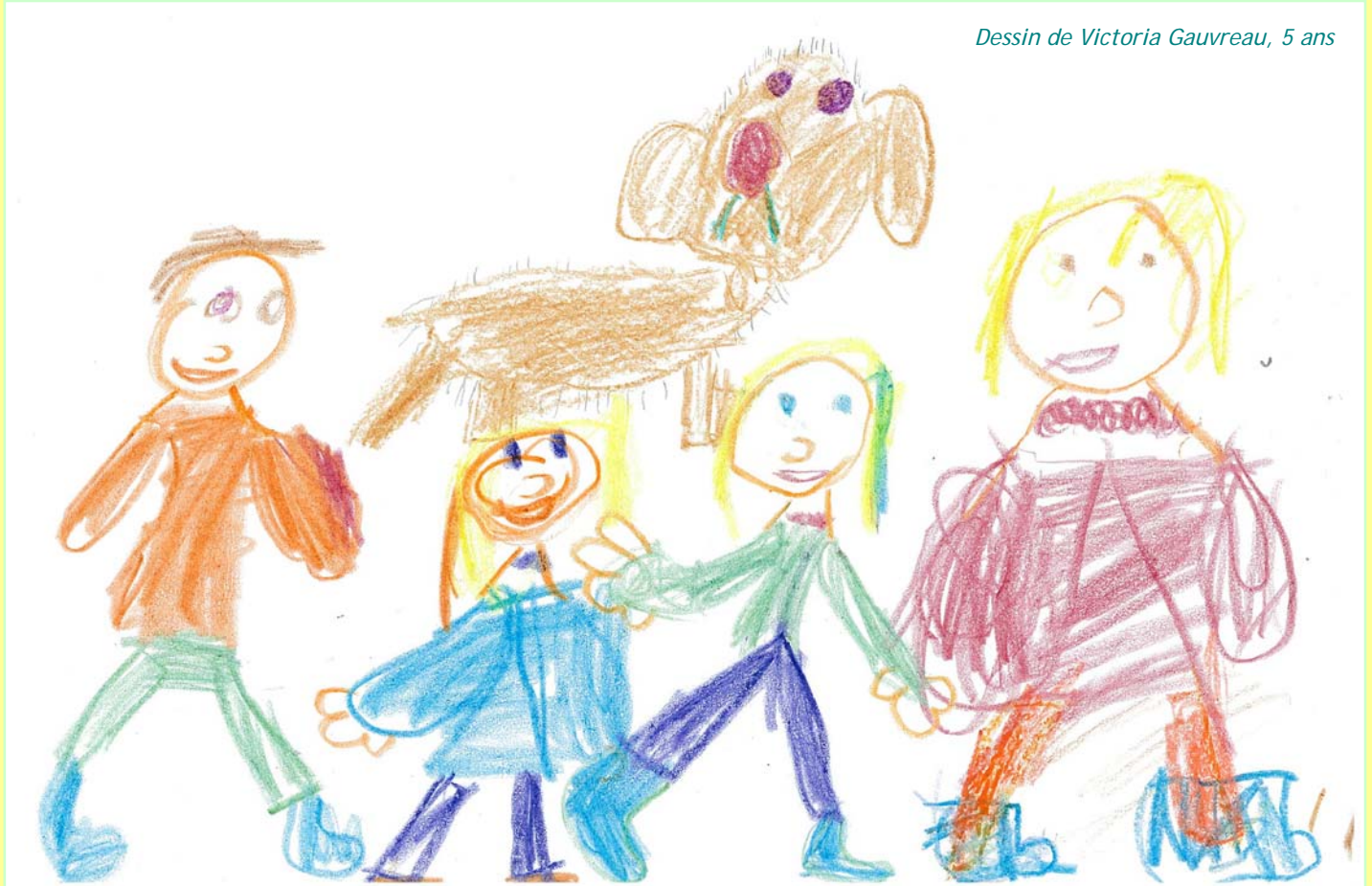
Dessin de Victoria Gauvreau, 5 ans